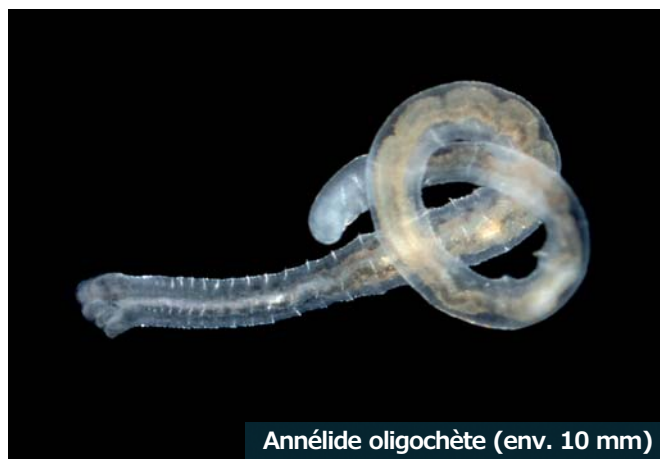
Annélide oligochète (env. 10 mm)