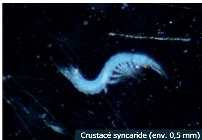
Crustacé syncaride (env. 0,5 mm)