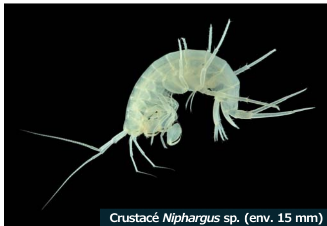
Crustacé Niphargus sp. (env. 15 mm)