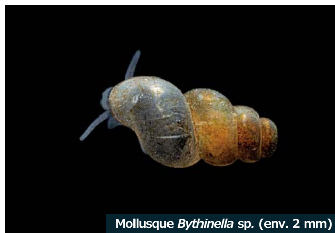
Mollusque Bythinella sp. (env. 2 mm)